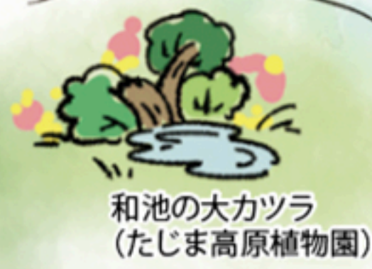
和池の大カツラ (たじま高原植物園)