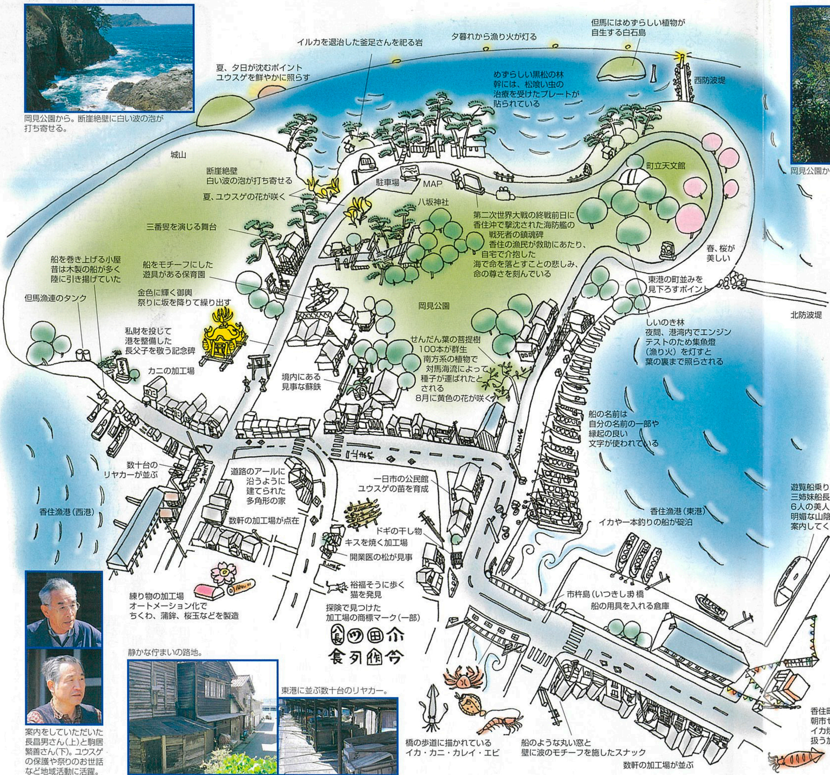
遊覧船乗り場 三姉妹船長で有名。現在は親子二代、6人の美人の船長さんが揃う。風光明媚な山陰海岸のクルージングへと案内してくれる。