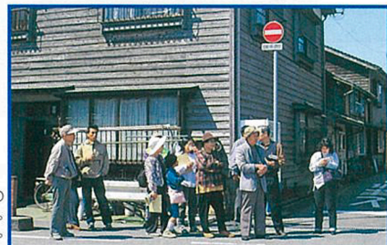
加工場を見学する探険隊員。扉を開けるとおいしいそうな魚の匂いがいっぱいひろがる。手際の良い仕事ぶりに感心しきり。新鮮でまるまるとした素材にもびっくり。魚の良さを再認識。

岡見公園のふもと、大きな電球をつけたイカや一本釣りの小型船が碇泊する東港と沖合漁業へ出かける大型船で賑わう西港に隣接。干し物・練り・焼きの水産加工場も多く、漁業と深い関わりを持つ。