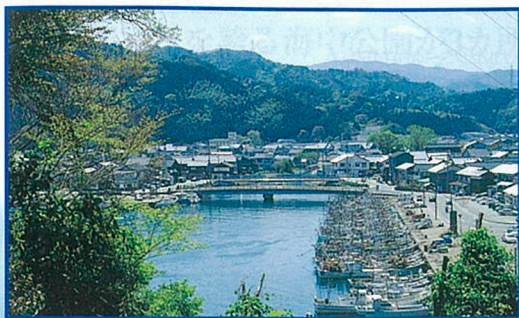
岡見公園から見下ろす東港周辺の町並み。