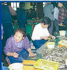
朝4時に起きて、準備にかかるというおばあちゃん、87歳。