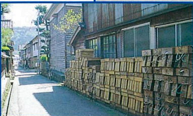
加工場に山積みされたトロッコ。民家の軒下にも違和感なく並ぶ。