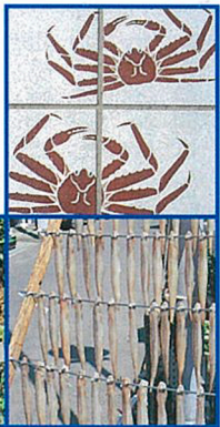
橋の歩道に描かれたカニの絵