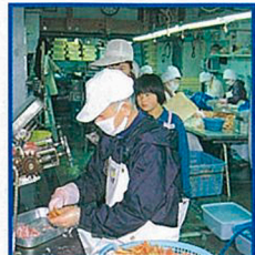
カニの加工場を見学。カニの身が見事に取り出される。