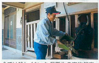
今では珍しくなった但馬牛の家族飼育。