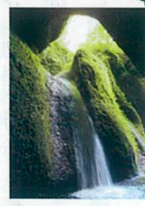
小又川溪谷は集落の上流にあり、県の名勝に指定。大小数多くの滝が点在し、中でも僧侶が修行したとされる「シワガラの滝(写真)」や、落差35メートルの「桂の滝」は美しい姿で知られる。植物や昆虫の化石も多く出土し、歴史的にも珍しい場所である。

●「裏路地探険」に参加してみませんか!! 平成25年7月13日(土) 10:00~12:00 「長寿の水を訪ねる」豊岡市竹野町羽入(はにゅう) *実施日の10日前までに、18ページ掲載のT2編集部へ、住所・氏名・年齢・電話番号・「裏路地参加希望」とお書きの上、ハガキで申し込みください。開催は午前中、現地集合・現地解散となります。申込締切日後、案内を参加ご希望の方へ送付致します。