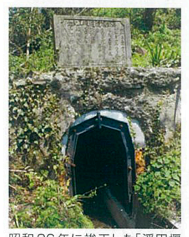
昭和26年に竣工した「浮田環隧道」は延長320メートル、6町歩の田畑の水を潤している。