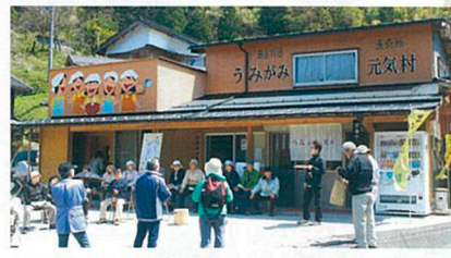
うみがみ元氣村は、平成23年4月にオープンした交流拠点施設。農産物の直売の他、牛肉うどんやぜんざいなどの料理も提供している。11月には収穫祭も開催。24時間利用できる休憩スペースを開放しており、上山高原や小又川溪谷の滝めぐりに訪れる人々に重宝されている。※水、土、日曜のみ営業(5人以上の予約があれば臨時営業)。