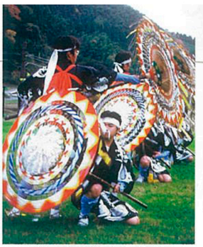
郷土芸能である「海上傘踊り」は、江戸末期に始まった雨乞いの踊り。鳥取県から伝わったとされるが、踊りも歌も独自に発展を遂げている。小学1年生になると教えられ、村の男性は誰でも踊ることができる。切れのあるダイナミックな所作は見応えがあり、傘に付けられた鈴の音が小気味よい。海外公演も行っており、フランスのニースではアンコールが起る盛況ぶりだったそう。現在は8月14日のお盆に披露される。