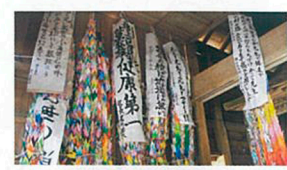
火山灰の中に埋もれ半分化石になった太古の杉(神代杉)。約2500年前のものとして推定。