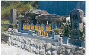
炭焼き小屋 集落の入り口にある「六地藏」は、地元の人2名による手作り。愛媛県まで習いに行き、冬の農閑期にコツコツと彫り上げた。屋根の石板も手作りで、皆が平和に暮らせるようにと、平成20年に建立した。