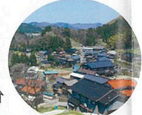
周囲を700〜900メートル級の山々に囲まれた海上。