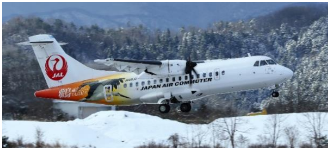
（但馬空港フォトコンテスト2018 コウノトリ号部門グランプリ受賞作品）

【7】コウノトリ但馬空港は、座席数が増えた新型機「ATR42-600」の導入や、就航率が好調だったこともあり、2018年度（平成30）に過去最高の年間利用者数を記録しましたが、初めて年間何万人を超えたのでしょうか。